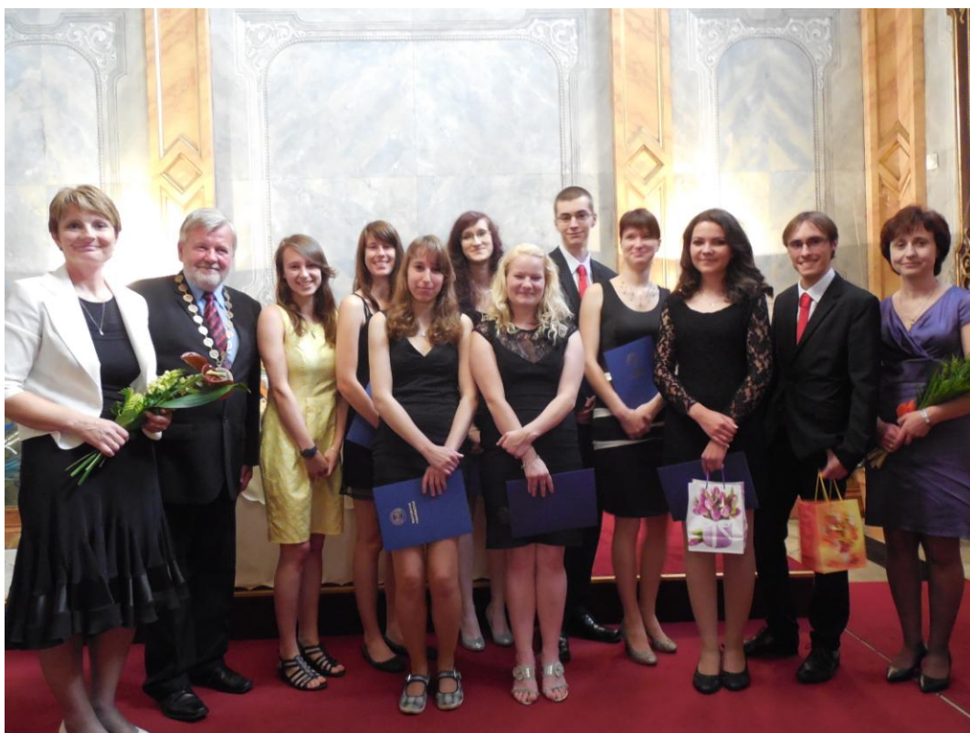
Obr. 20 Slavnostní předávání maturitních vysvědčení (23. května 2014)