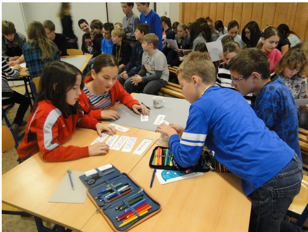
Obr. 9 Lentilková soutěž pro žáky primy a sekundy (17. 12. 2013)