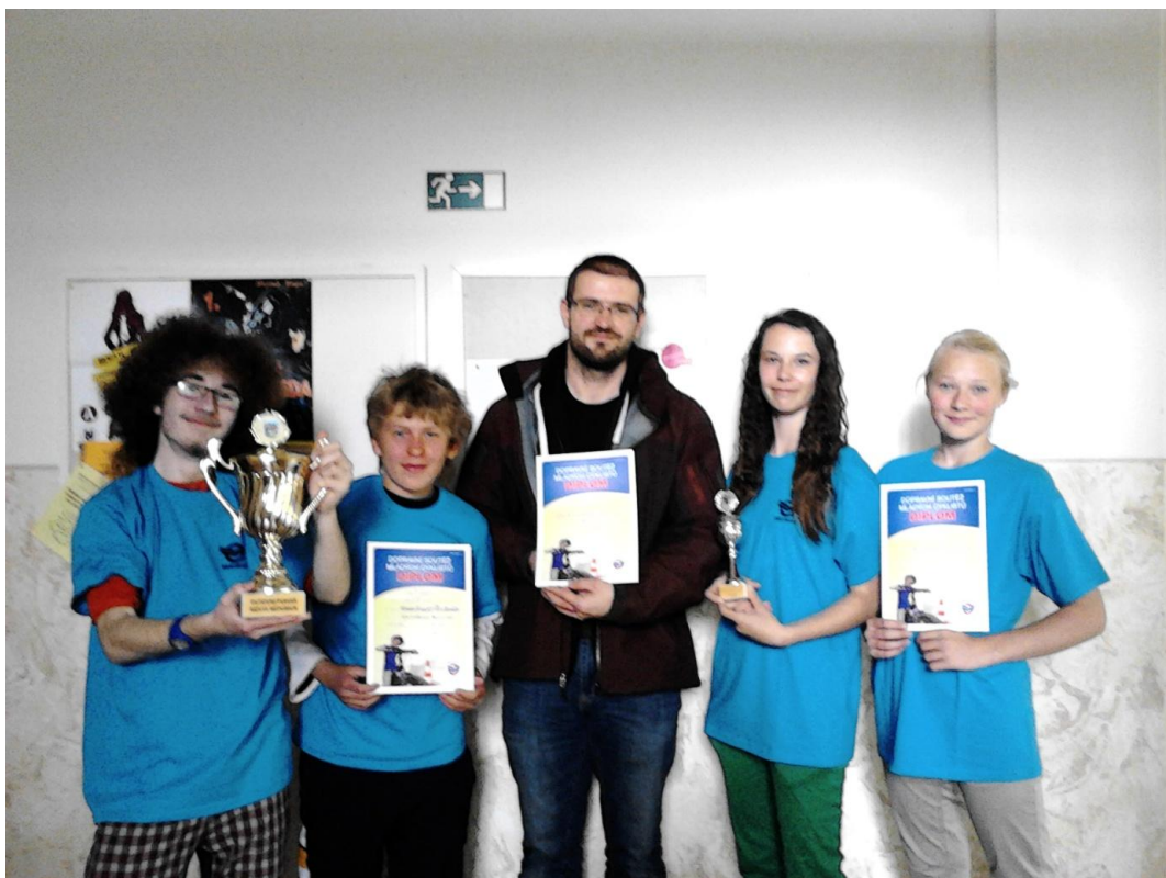
Obr. 17 BESIP (12. května 2014)