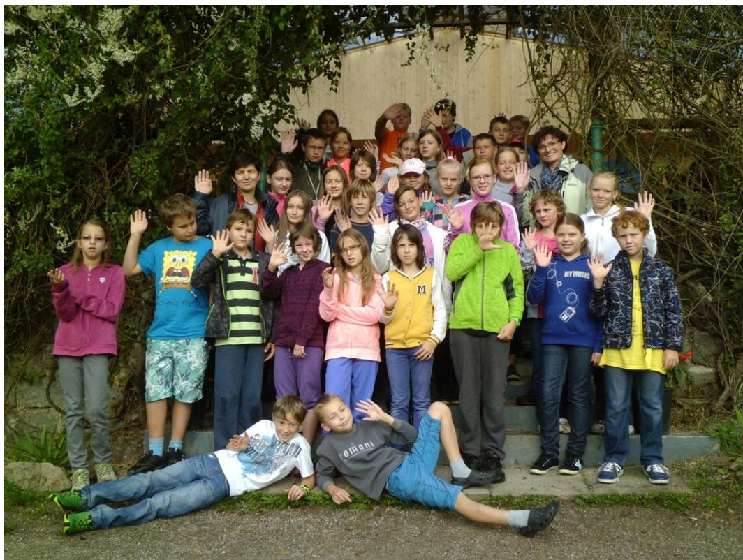
Obr. 1 Společná fotografie žáků a učitelů – Adaptační kurz třídy primy (2. – 4. 9. 2013)