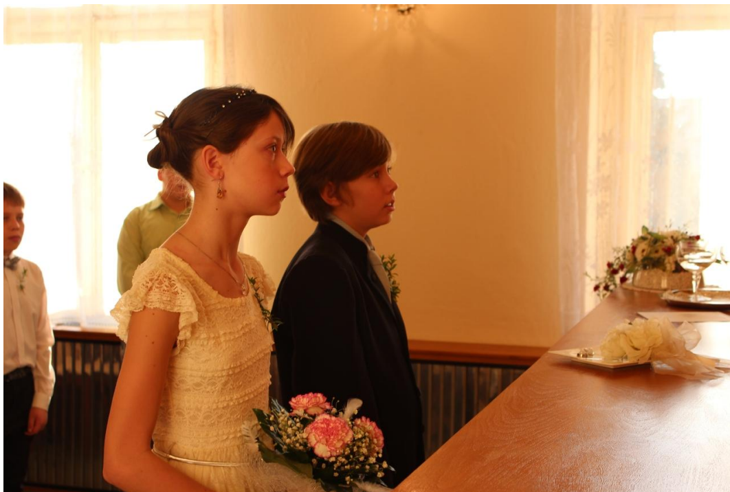
Obr. 11 Svatební obřad třídy primy (19. 12. 2013)