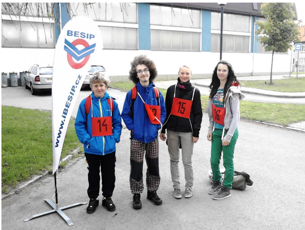
Obr. 16 BESIP (12. května 2014)