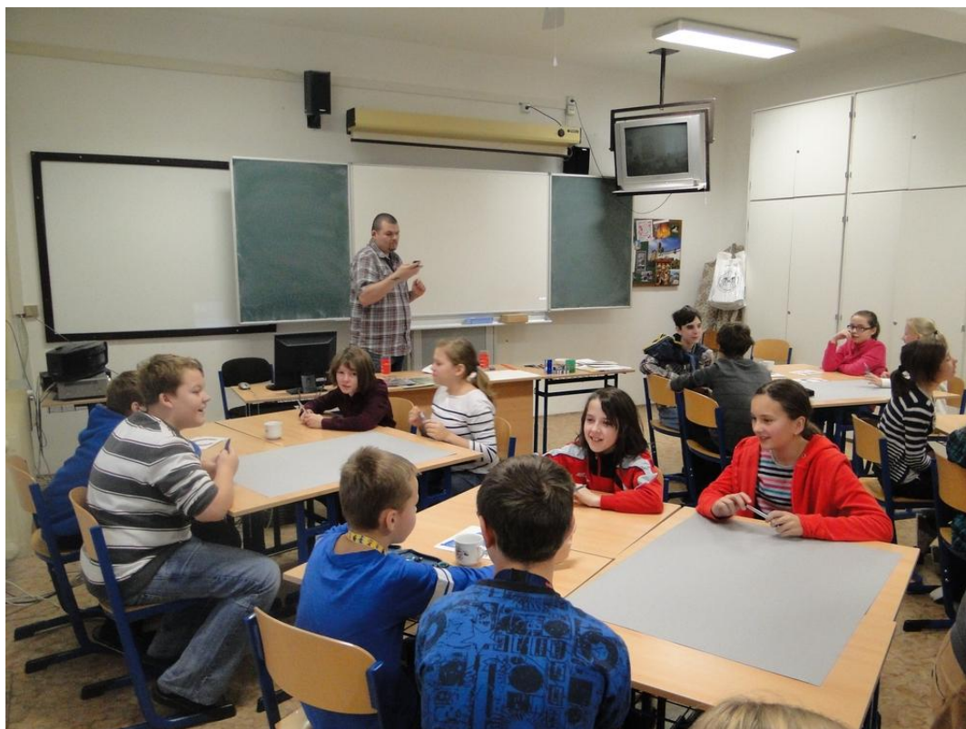
Obr. 7 Lentilková soutěž pro žáky primy a sekundy (17. 12. 2013)