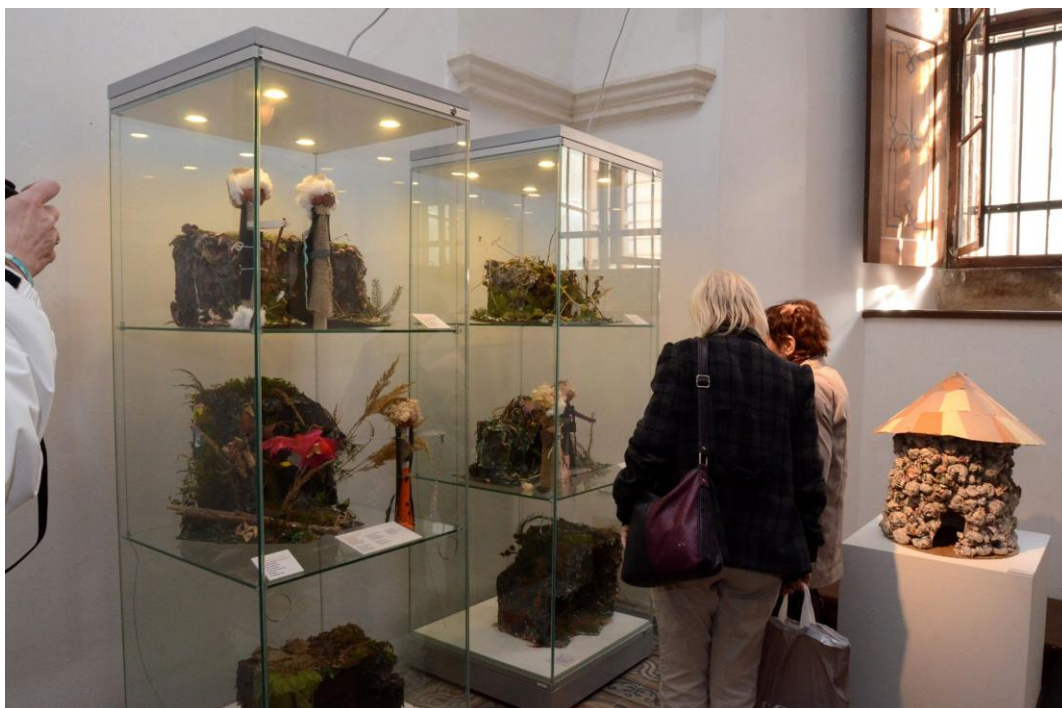
Obr. 18 Výstava žákovských prací – Poustevníci a pustevny