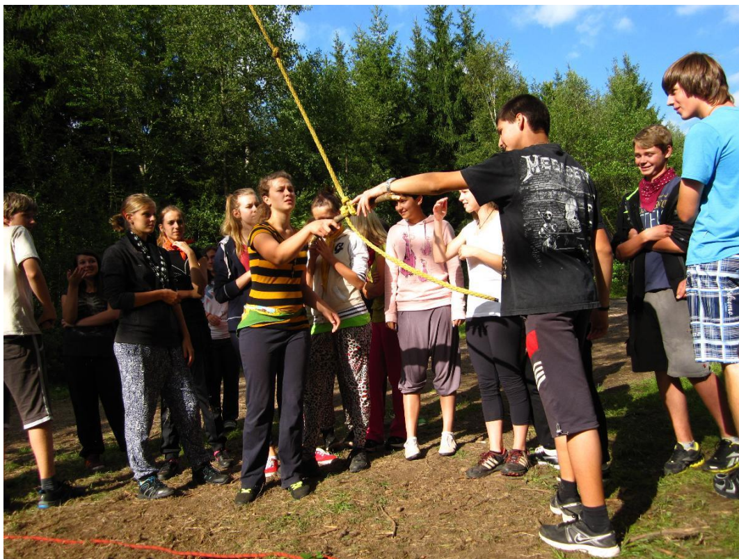
Obr. 3 Aktivita Pandora – Adaptační kurz třídy 1. ročník (4. – 6. 9. 2013)