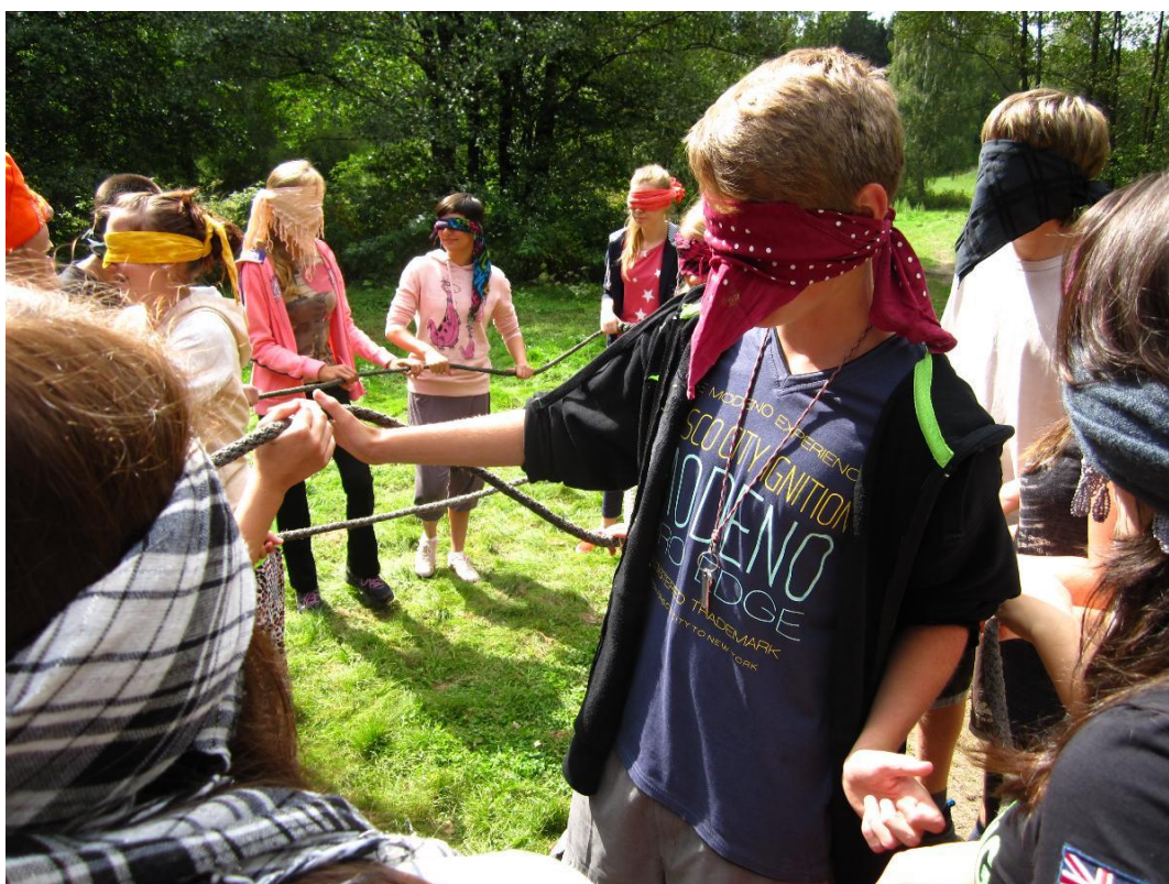
Obr. 4 Aktivita Slepý čtverec – Adaptační kurz třídy 1. ročník (4. – 6. 9. 2013)