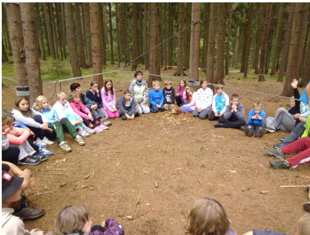
Obr. 2 Rozebírání kooperace na lanové dráze – Adaptační kurz třídy primy