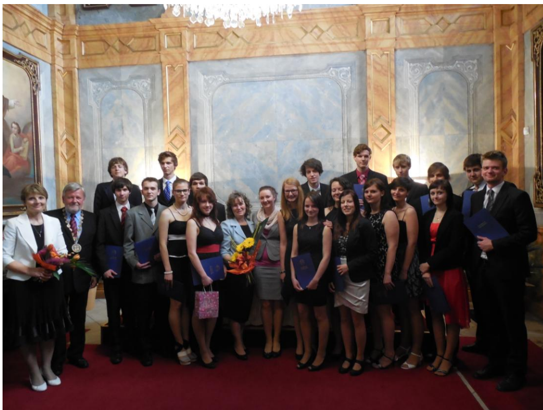
Obr. 19 Slavnostní předávání maturitních vysvědčení (23. května 2014)