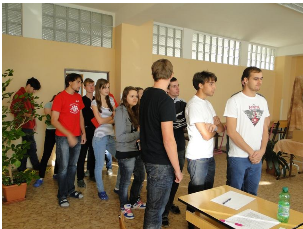
Obr. 6 Studentské volby – říjen 2013