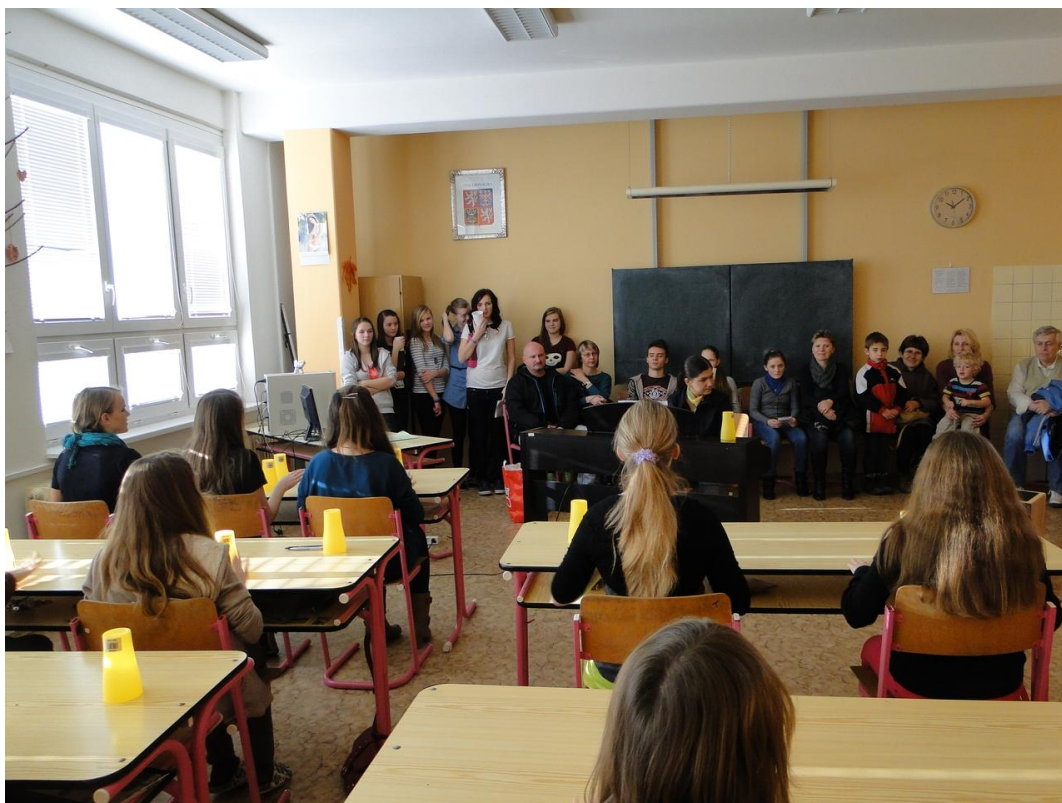
Obr. 15 Den otevřených dveří (11. ledna 2014)