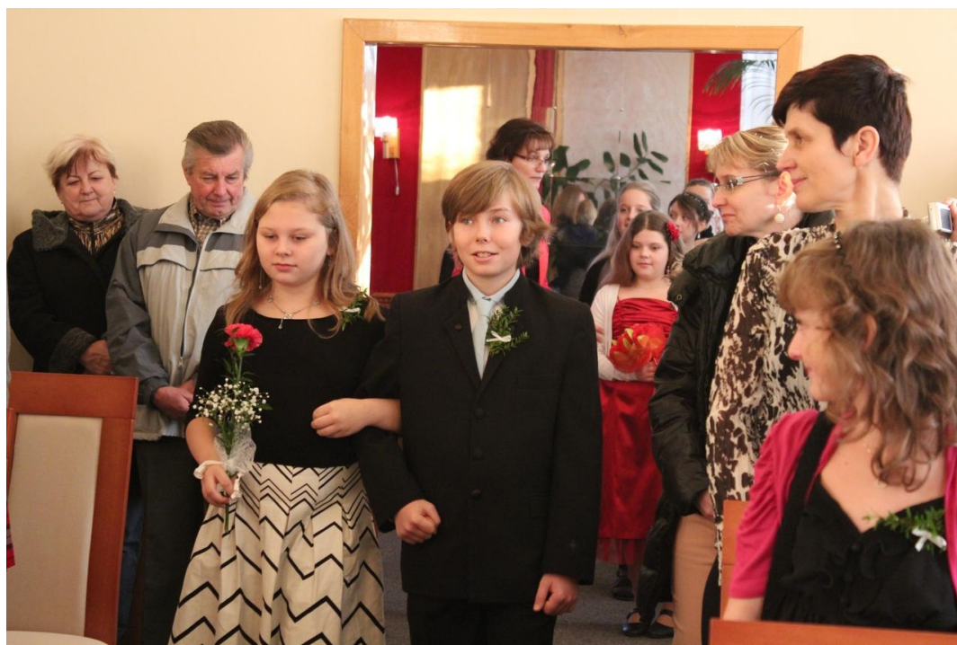
Obr. 10 Svatební obřad třídy primy (19. 12. 2013)