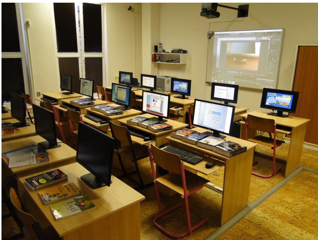
Obr. 14 Den otevřených dveří (11. ledna 2014)