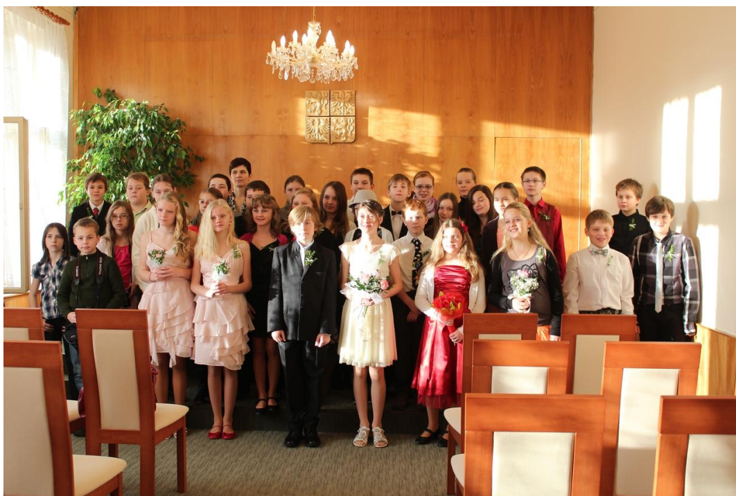
Obr. 12 Svatební obřad třídy primy (19. 12. 2013)