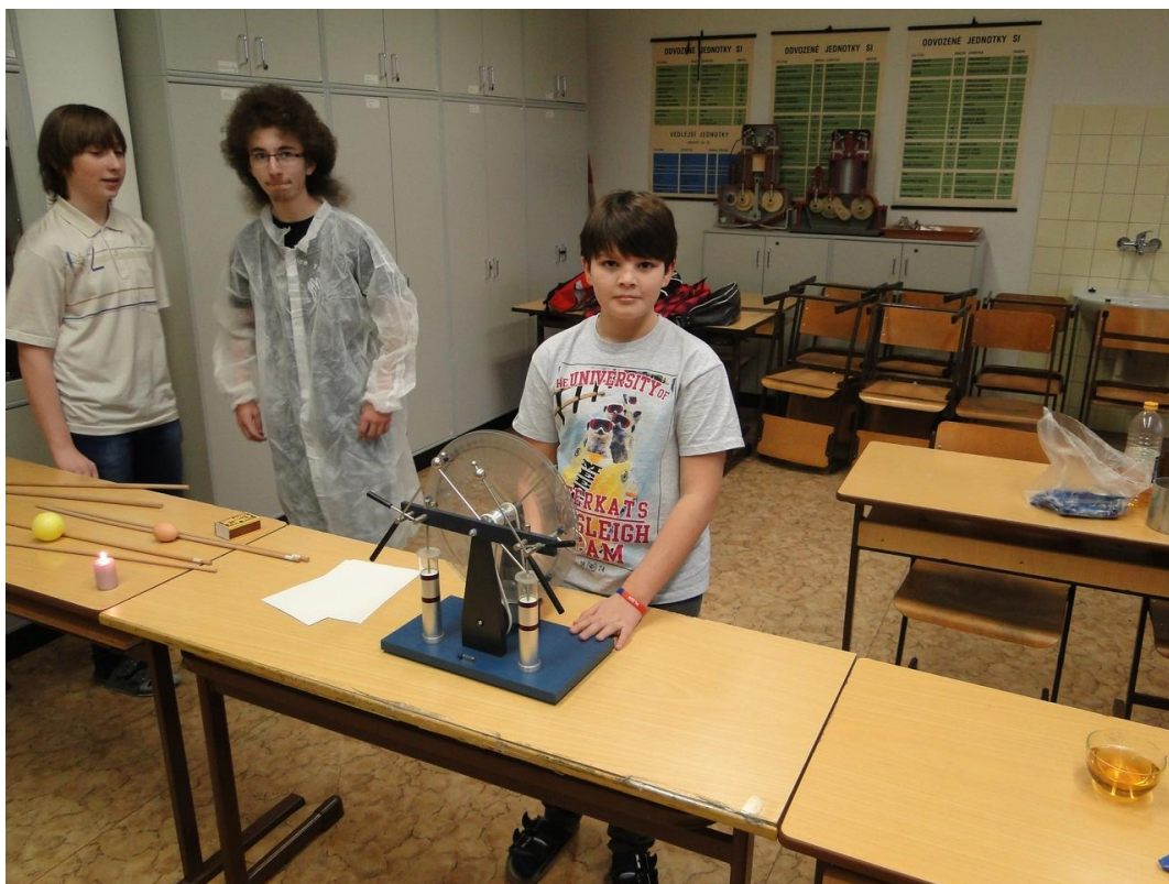
Obr. 13 Den otevřených dveří (11. ledna 2014)