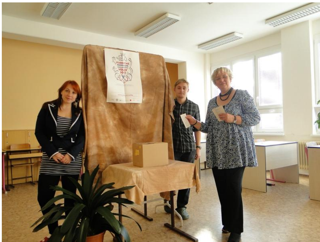
Obr. 5 Studentské volby – říjen 2013